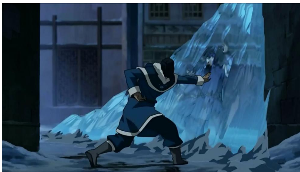
"Night of a Thousand Stars", írta Joshua Hamilton, r. Colin Heck. Első közvetítés: 2013. november 5., The Legend of Korra , 23. epizód (A második könyv: Szellemek 11. epizódja), Nickelodeon.

jelenetek koreografálásánál. Az idomárok az elemeket nem csupán közelharcban használják, mintegy a testük, illetve végtagjaik meghosszabbításaként, hanem a környezetük alakítására, átformálására is képesek az adott elem segítségével. A közelharc szempontjából az idomítás fegyverforgatásnak is tekinthető, ám ebben az esetben egy olyan fiktív fegyverként képzelhető el, ami tökéletesen idomul a használója minden egyes mozdulatához; formálhatóságának, kezelhetőségének pedig csupán az idomár képzeletereje szab határt. A környezet formálása esetén az adott elem fedezéket biztosít, illetve segítségével helyzeti előnyhöz juthatnak az idomárok.